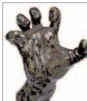
Auguste Rodin La ma crispada , ca. 1880 Bronze Fine Arts Museums of San Francisco

Les mans han tingut un tractament important al llarg de la història de l'art, ja que són, juntament amb el rostre, primordials per transmetre l'emoció i l'acció del personatge. Hi ha escultures, quadres i dibuixos que, només mostrant mans, aconsegueixen transmetre l'emoció d'un personatge. Fixeu-vos, si no, en l'escultura de bronze creada per Auguste Rodin: es fàcil imaginar-se el rostre desencaixat per la ira que correspon a aquesta mà crispada. En canvi, les mans pregant dibuixades per Albrecht Dürer ens fan imaginar un cos i un rostre plens de serenor.